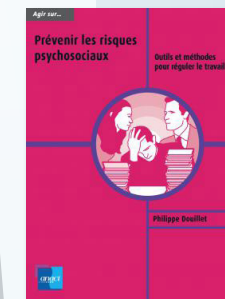
« Agir sur... » Prévenir les risques psychosociaux au travail. Réseau Anact-Aract

par un consultant signataire de la charte régionale de prévention des RPS