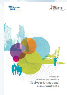
ED 6070 INRS « Présentation des RPS : Et si vous faisiez appel à un consultant ? »