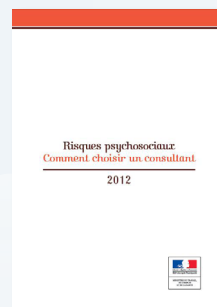
Guide du ministère du travail DGT : « Comment choisir un consultant »

SE FAIRE ACCOMPAGNER par un consultant engagé par la CHARTRE RPS en Bretagne