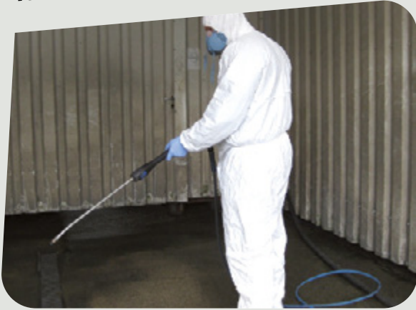
Albéric DUFOUR-VIET ©

Les produits de nettoyage et de rénovation contiennent des substances dangereuses (soude, aminoéthanol, formaldéhyde, acide fluorhydrique, produits pétroliers dans rénovateurs pour plastique et caoutchouc...) prenez toutes les précautions nécessaires lors de leurs utilisations (pulvérisation/émanations).