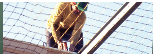
3 Filets de recueil

Pour un accompagnement personnalisé ou pour plus d'informations :