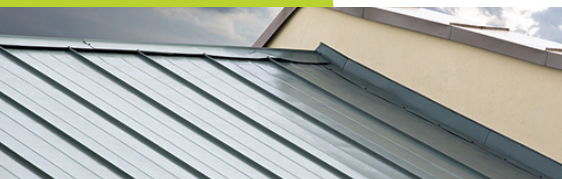
1 Toiture en bac acier