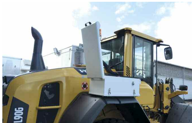
Caisson Brotec "dernière génération" avec cartouche de préfiltration à décolmatage automatique