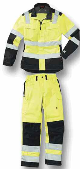
Classe 3 Ensemble pantalon + veste ou combinaison

▶ Code du travail, R. 4224-3 : “Les lieux de travail intérieurs et extérieurs sont aménagés de telle façon que la circulation des piétons et des véhicules puisse se faire de manière sûre.”