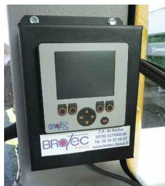
Boîtier d'affichage de la pression en cabine (Brotec)