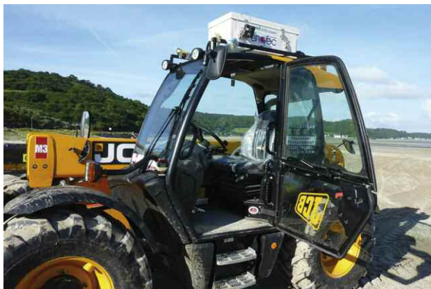
Caisson Brotec "première génération"

Illustrations de ce cahier des charges par des photos de matériel existant