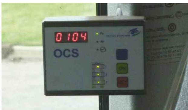
Boîtier d'affichage de la pression en cabine (Transelektro et BM Air)