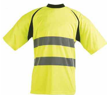
Classe 2 Gilet, chasuble, polo, tee-shirt

Toute personne intervenant à pied sur le domaine public à l'occasion d'un chantier ou d'un danger temporaire doit revêtir un vêtement de signalisation à haute visibilité de classe 2 ou 3 afin d'être constamment visible, tant par les usagers que par les conducteurs d'engin.