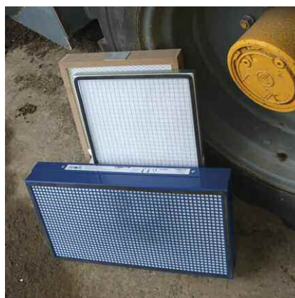
Jeu de 3 filtres 600 x 336 mm