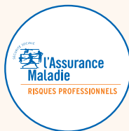
CPAM ou CGSS/CSS en outre-mer