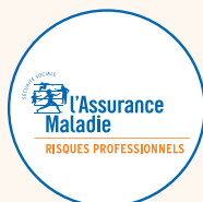
Carsat, Cramif ou CGSS/CSS en outre-mer

calcule et notifie le taux AT/MP sur net-entreprises.fr