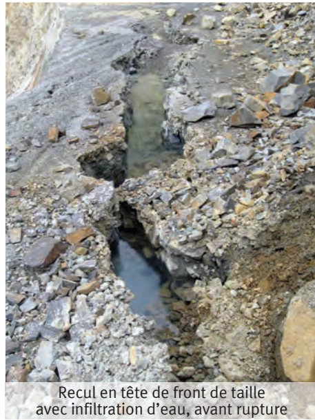
Recul en tête de front de taille avec infiltration d'eau, avant rupture