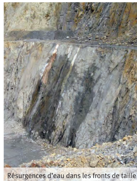
Résurgences d'eau dans les fronts de taille