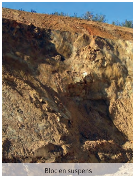
Bloc en suspens