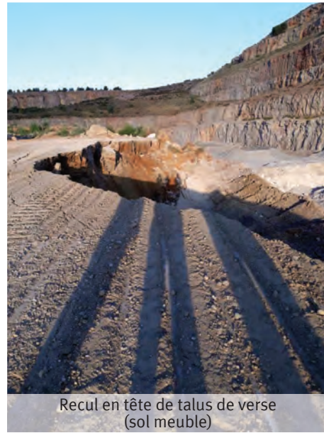
Recul en tête de talus de verse (sol meuble)