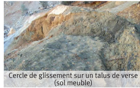
Cercle de glissement sur un talus de verse (sol meuble)