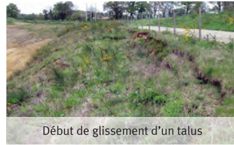
Début de glissement d'un talus